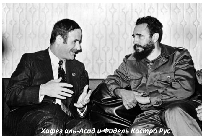
Хафез аль-Асад и Фидель Кастро Рус