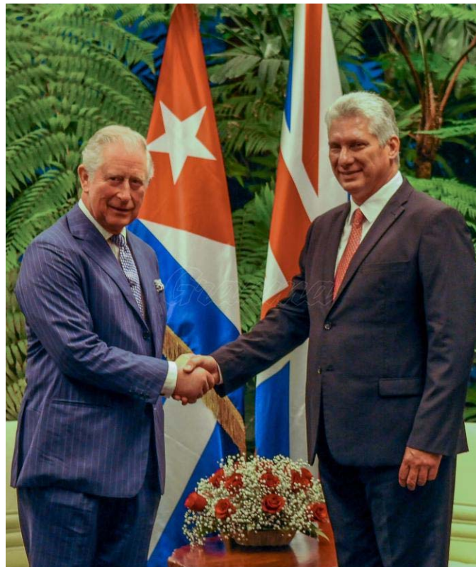
В понедельник, 25 марта 2019г., Президент государственных советов и министров Республики Куба Мигель Диас-Канель Бермудес принял его королевское высочество принца Уэльского, который совершил официальный визит на Кубу.

«Когда враги продолжают бросать вызов настоящему и будущему Родины, их завоеваниям и священным устремлениям, с помощью различных и тонких методов они необходимы как никогда раньше», - сказал он.